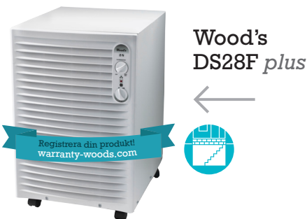
Wood's DS28F plus

Visste du att man kan koppla en vattenslang till alla Wood's avfuktare?