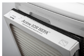
Active ION HEPA filter