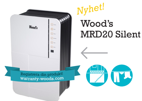
Nyhet! Wood's MRD20 Silent

Wood's MRD20 Silent har samma smarta funktioner som MRD17 och MRD20, men med ännu högre kapacitet och med lägre ljudnivå! Det gör att den kan avfukta större ytor, snabbare och mer energieffektivt. 3-års garanti när du registrerar din produkt.