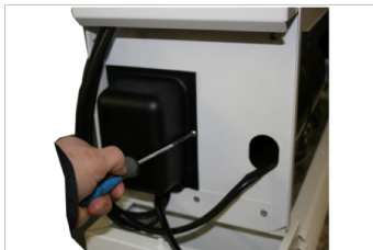
4. Nuimkite plastikini elektrinės dalies dangtį.