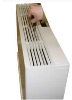
1. Atsukite korpuso varžtus.