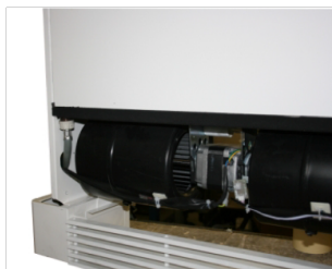
3. Prijunkite vandens nutekėjimo vamzdį (diametras 3/4").