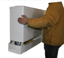
2. Nuimkite korpuso dangtį.